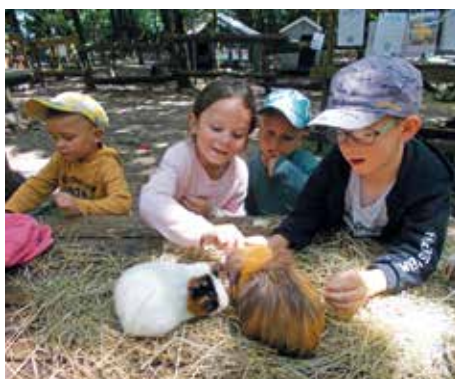
Soins aux animaux de la ferme