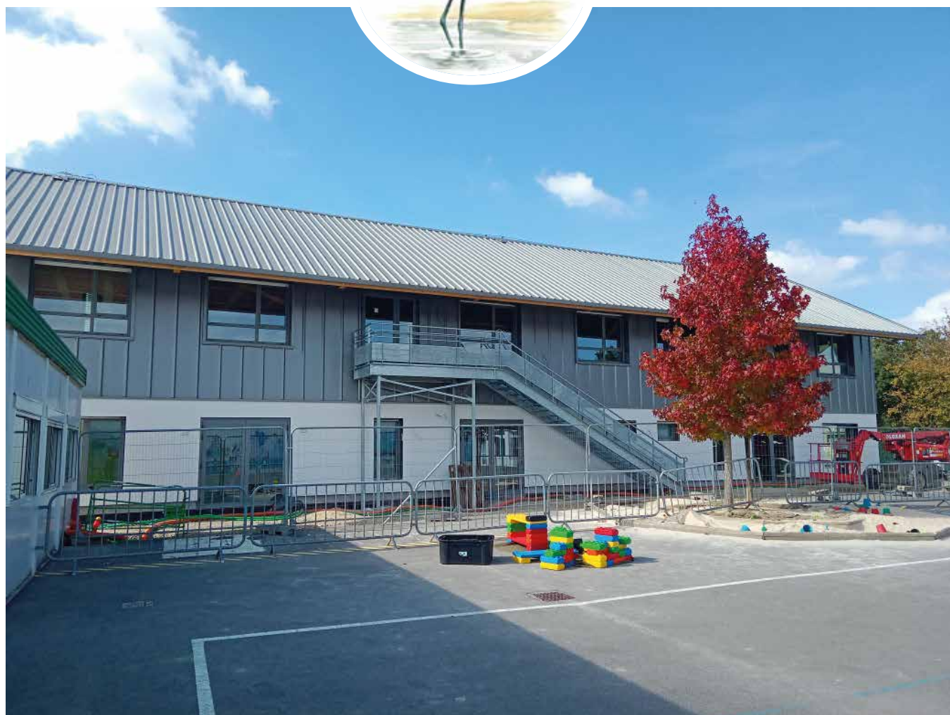
Nouvelle école en construction