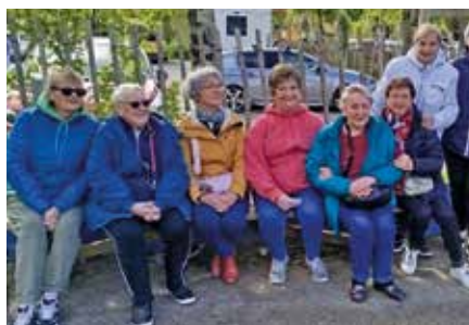
Sortie à Planète sauvage