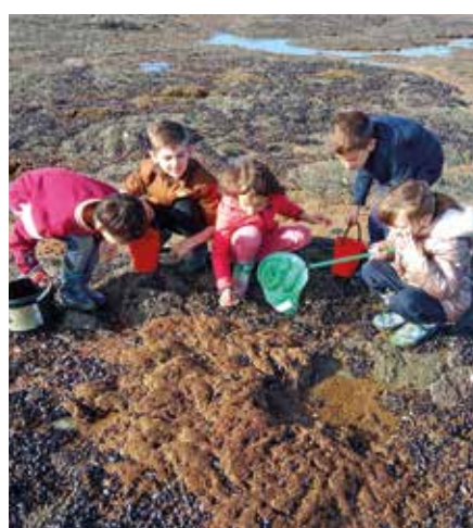
Observation de la faune et de la flore sur l'estran à Sion