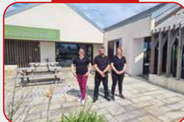
Ouverture au comptoir urbinois