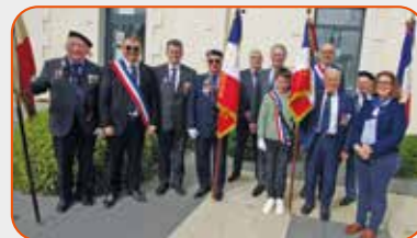
Cérémonie de remise des drapeaux du Devoir de mémoire et de Soldat de France