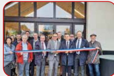
Inauguration de l'Api Supérette, du café-restaurant, des aménagements du centre-bourg et de l'alambic municipal