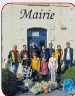
Ramassage des déchets