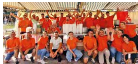
Membres du Comité des Fêtes