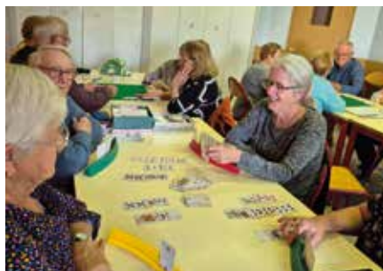
Jeux de cartes et de société avec goûter