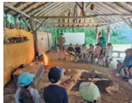
Visite au Préhisto'site de Saint Hilaire la Forêt

Inscriptions toute l'année en mairie 02 51 68 73 34 accueil@sainturbain.fr