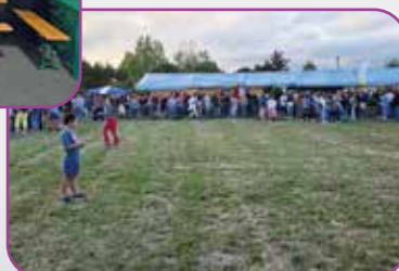
Soirée Moule Frite organisée par le Comité des fêtes