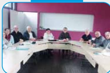
Conseil des sages