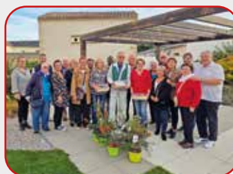
Les Maisons Fleuries