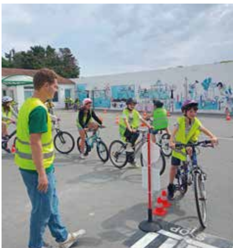
Savoir rouler à vélo avec la prévention routière de Challans Gols