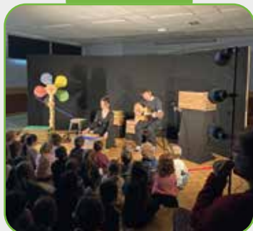
Spectacle offert aux écoles