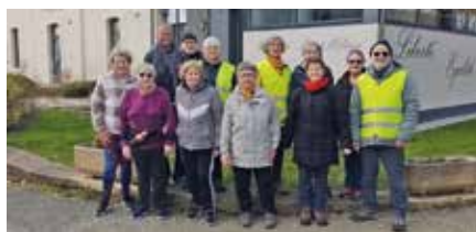
Randonnée qui a lieu les mercredis de 10h à 12h