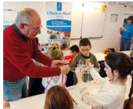
Atelier nœuds marins avec l'Outil en Main de Beauvoir/Mer