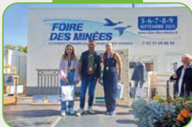
Foire des minées