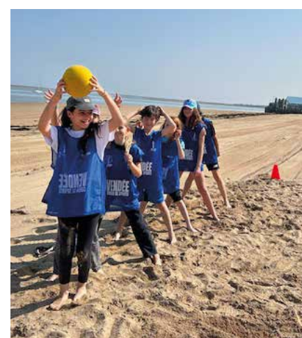
Journée voile à la Barre de Monts